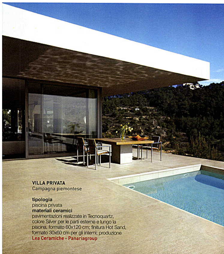
VILLA PRIVATA Campagna piemontese