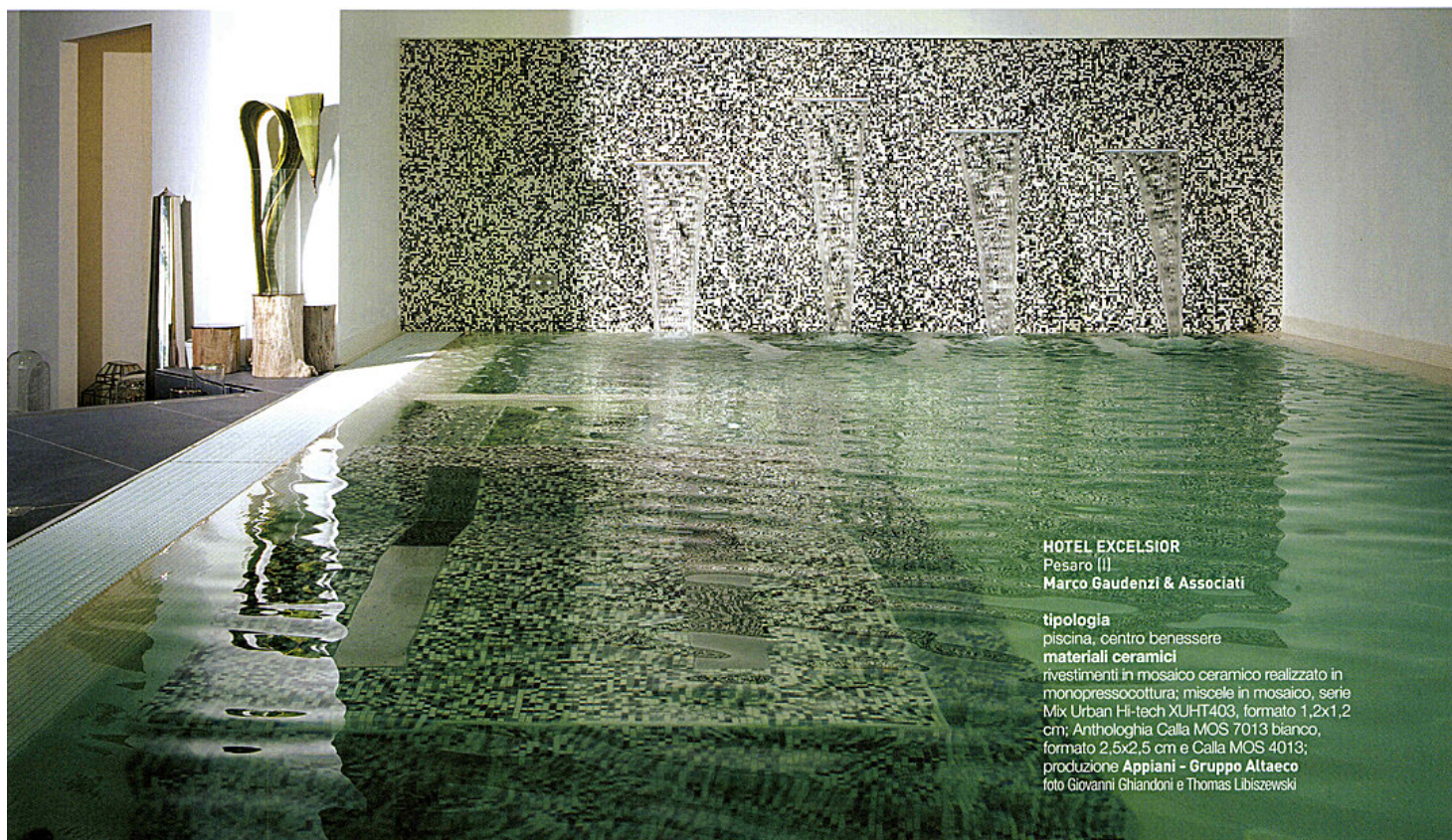
HOTEL EXCELSIOR Pesaro (I) Marco Gaudenzi & Associati

tipologia piscina, centro benessere materiali ceramici rivestimenti in mosaico ceramico realizzato in monopressocottura; miscele in mosaico, serie Mix Urban Hi-tech XUHT403, formato 1,2x1,2 cm; Anthologhia Calla MOS 7013 bianco, formato 2,5x2,5 cm e Calla MOS 4013; produzione Appiani - Gruppo Altaeco